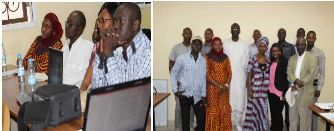
Quelques membres du jury et la photo de famille

Enfin le mercredi 18 Mars 2015, a eu lieu à 16h au Campus Pédagogique, l'ultime étape du Concours d'idées de projets. Au total 28 idées de projets mobilisant 65 apprenants ont été déposées auprès du jury.