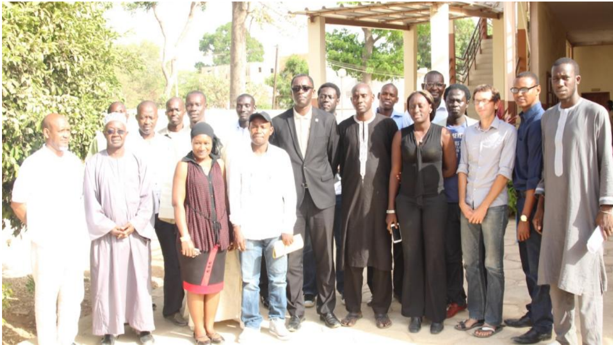
Photo de famille des mentors du CEEJ avec des autorités administratives et pédagogiques

L'importance de cette activité c'est que les jeunes ont l'opportunité d'être encadré, coaché et suivi par des personnes qui ont beaucoup d'expérience dans le secteur d'activité dans lequel ils comptent évoluer. Ils peuvent échanger, partager avec ces mentors qui ont un vécu considérable et une expertise soutenue dans ce qu'ils font.