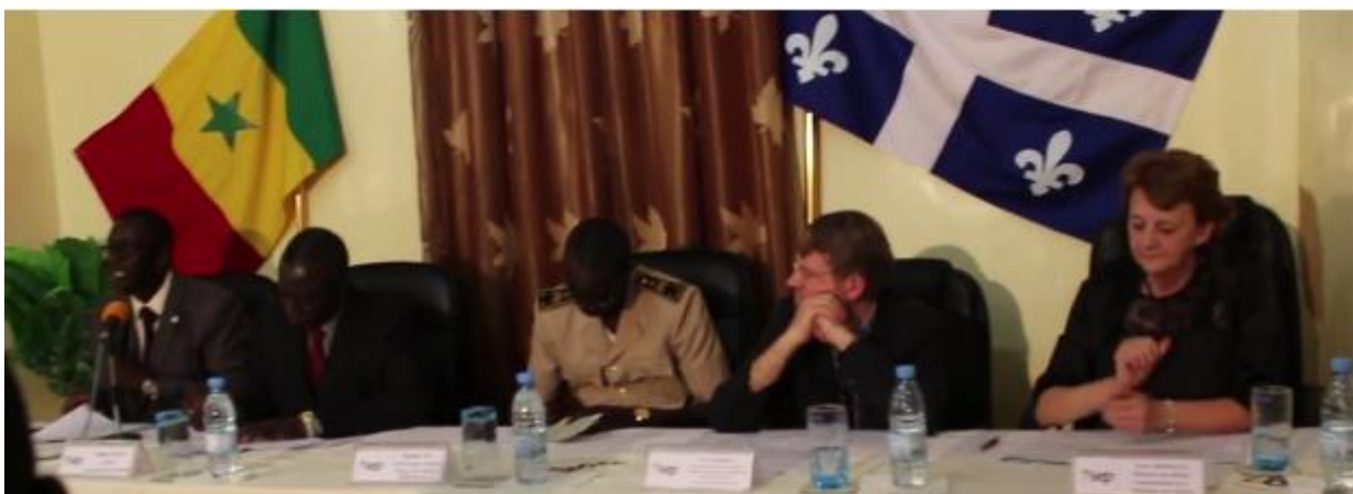
Lancement du Centre d'Excellence en Entrepreneuriat Jeunesse de Thiès par les autorités