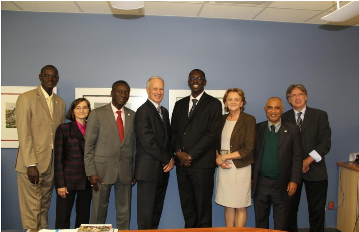
Les membres du comité de pilotage de ce partenariat