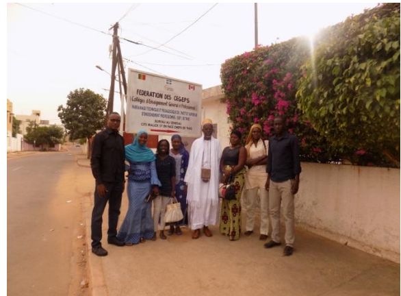
Les diplômés de la 2éme promotion (filiale Tourisme et Loisirs)