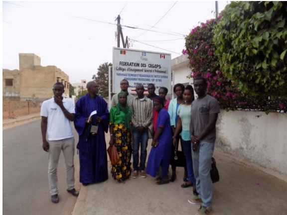
Les diplômés de la 1ere promotion (filiales Tourisme, Exploitation Agricole, Systèmes et Réseaux Informatiques)