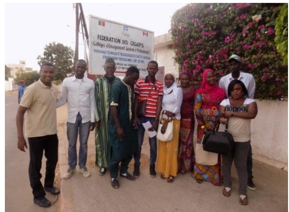
Les diplômés de la 2éme promotion (filiale Exploitation Agricole)