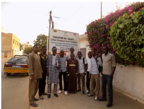
Les diplômés de la 2éme promotion (filiale Systèmes et Réseaux Informatique- Multimédia).